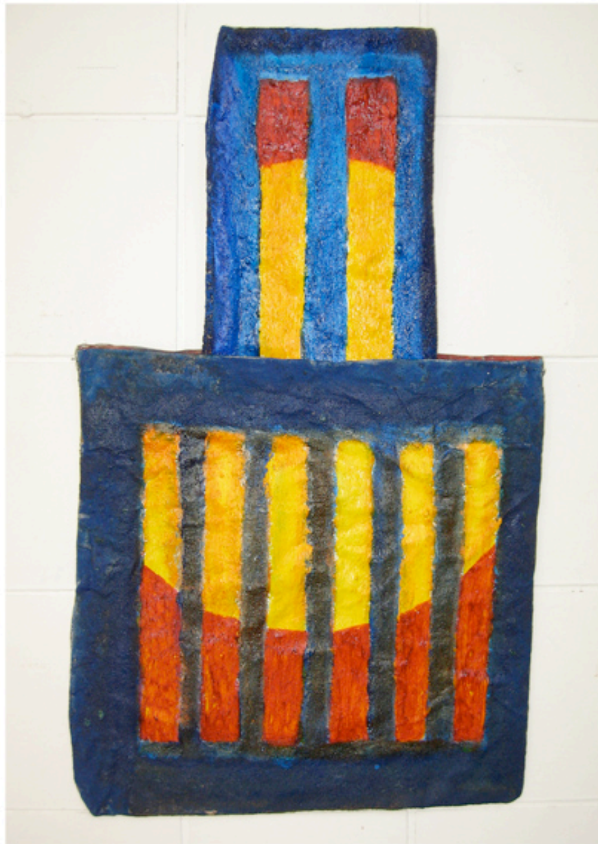
La Perle Gothique de Burgos et le Sac de Rêve du Soleil