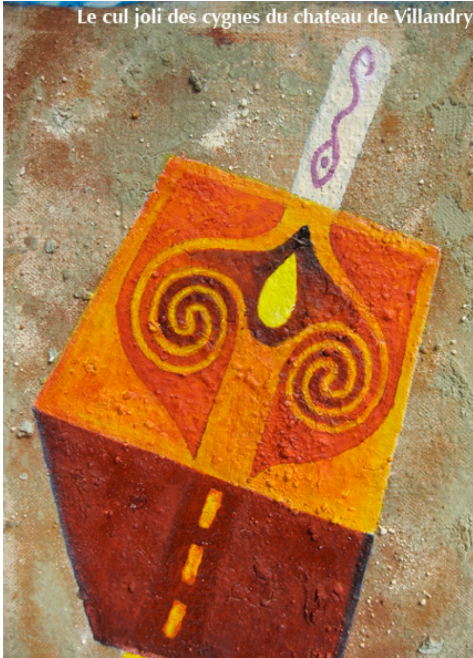
Le cul joli des cygnes du chateau de Villandry et l'entrelac des signes du Cercles des Rencontres