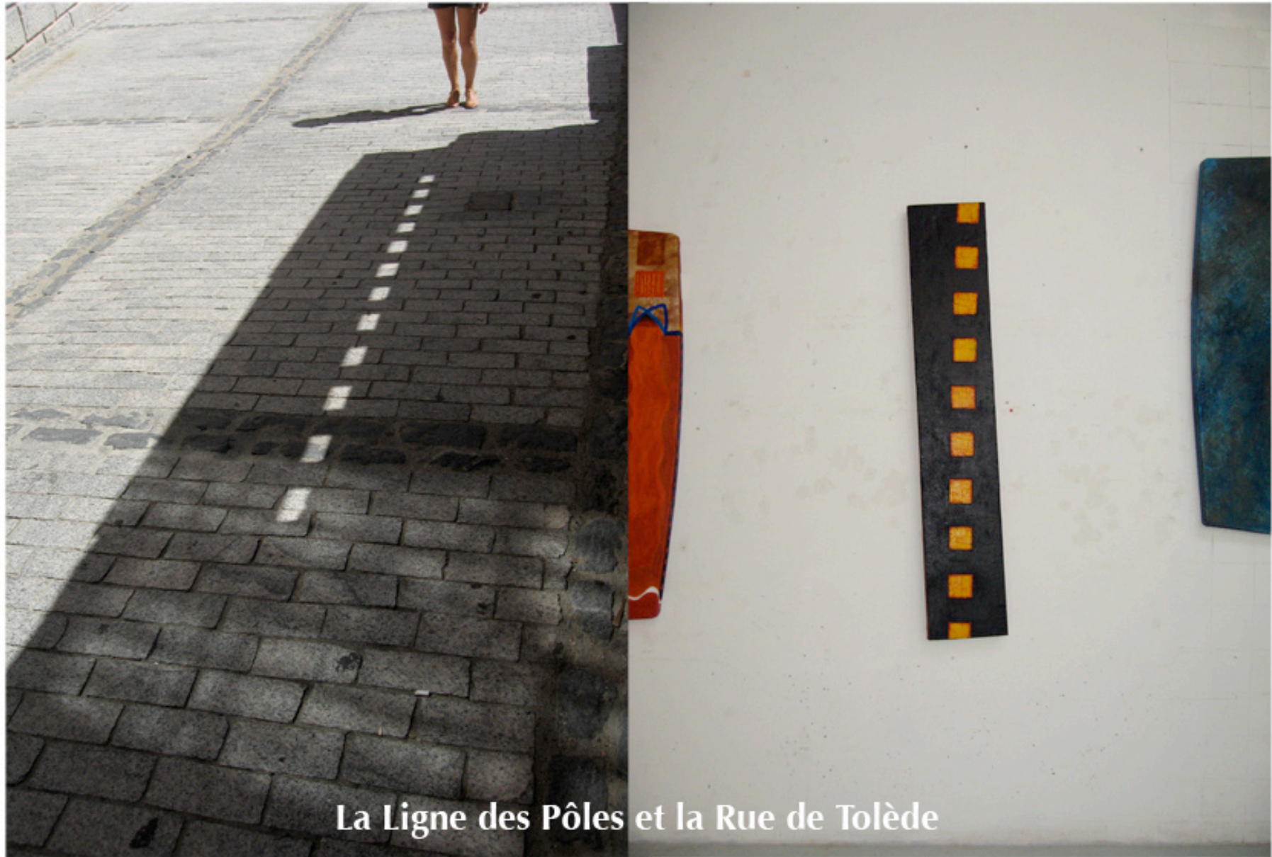
La Ligne des Pôles et la Rue de Tolède