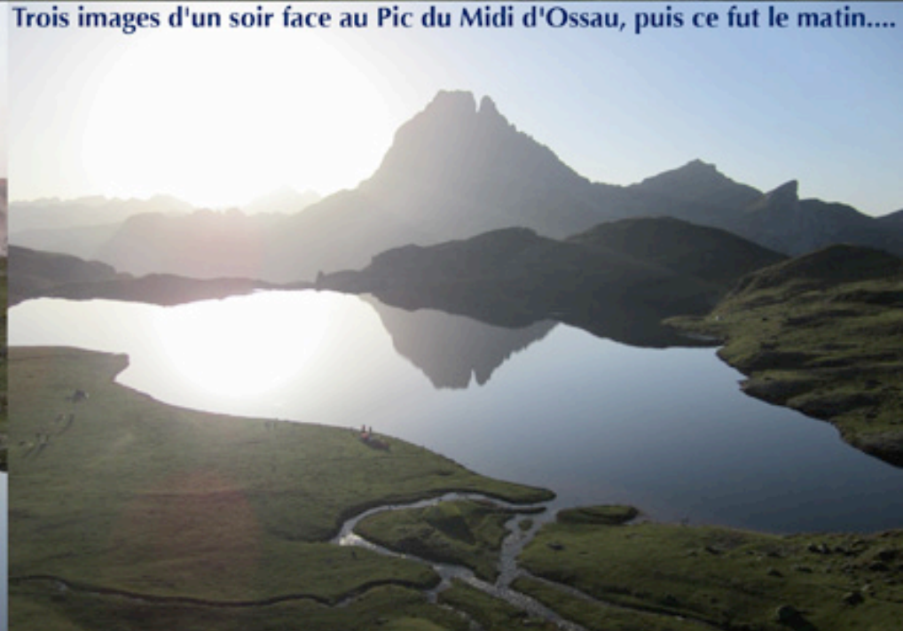
Trois images d'un soir face au Pic du Midi d'Ossau, puis ce fut le matin....