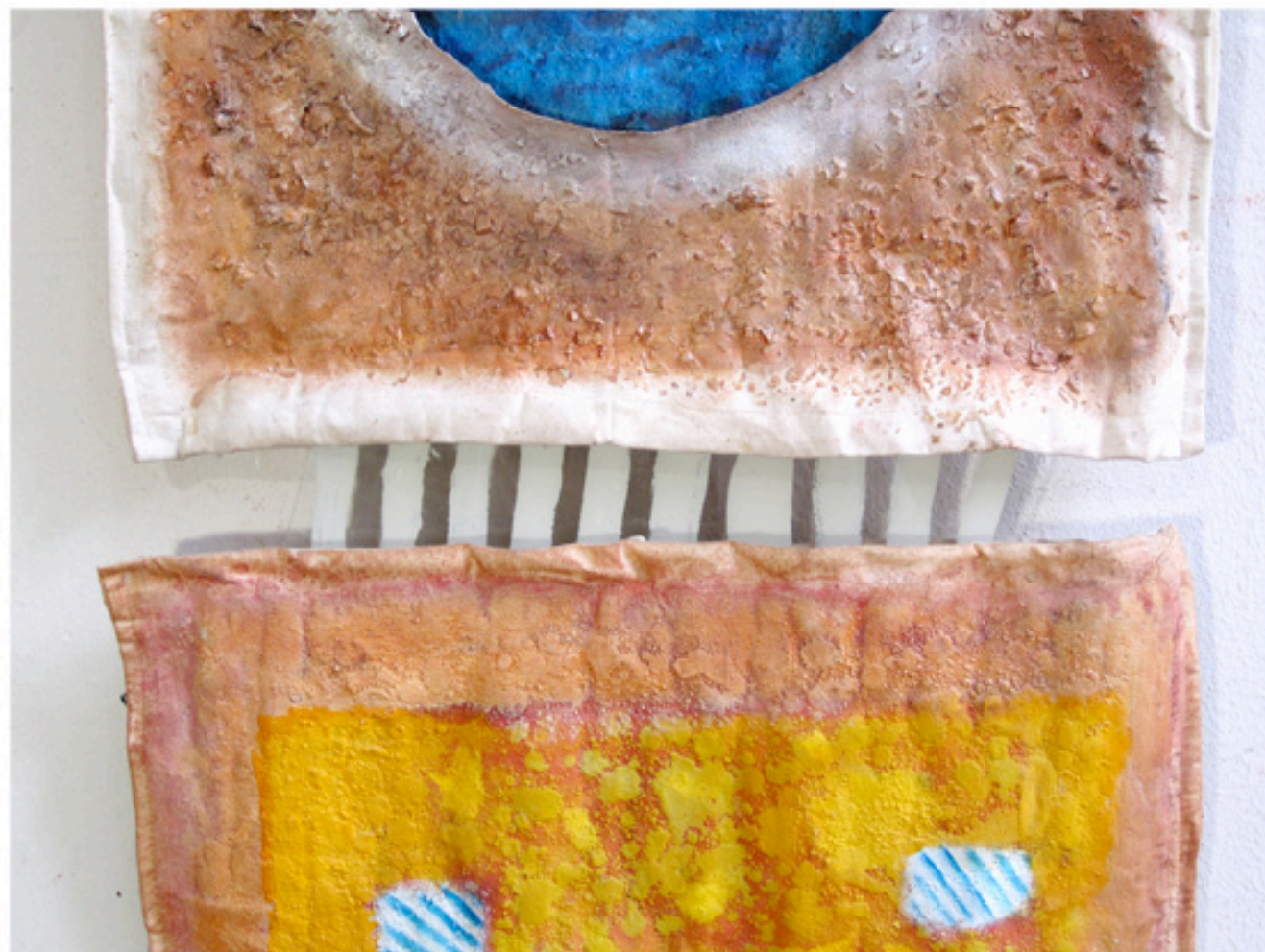
Huile sur deux sacs de toile, sable, pierre, plaque de verre et fragments de miroir. 127x54cm. 2011